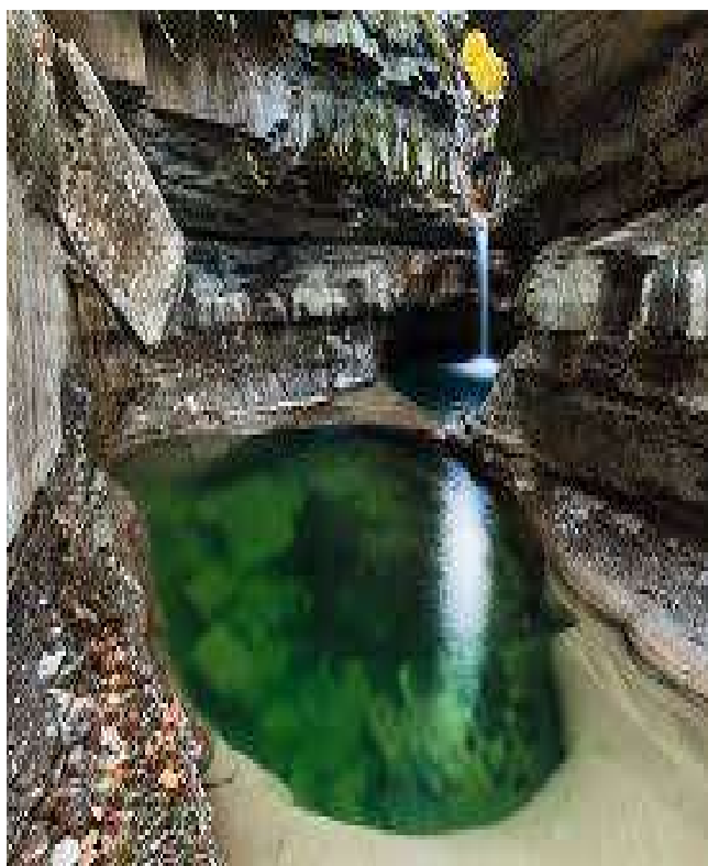
Foto di Premilcuore e Fiumicello