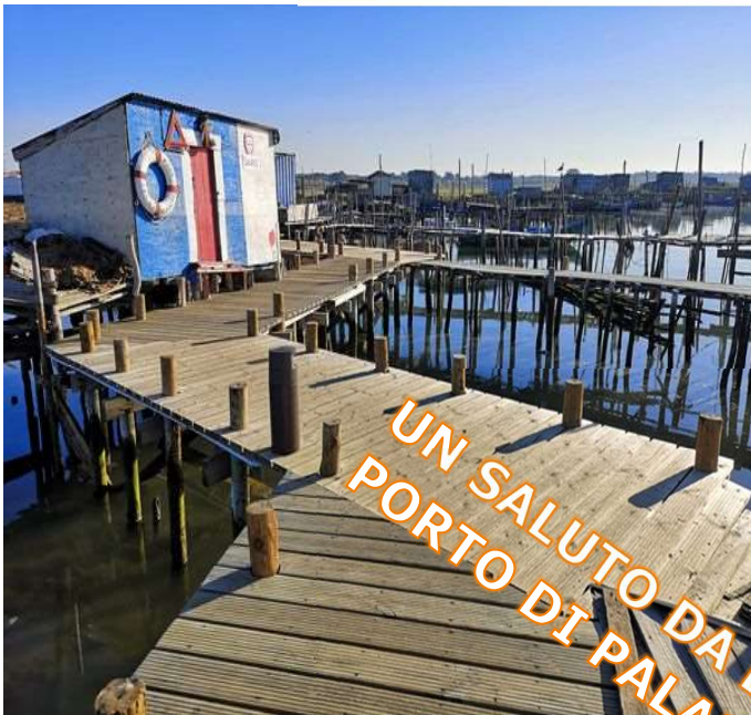
Foto che i nostri amici ci hanno inviato dal Portogallo e dalla Spagna